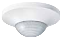
Detector de presencia Argus

Productos que intervienen en esta solución: