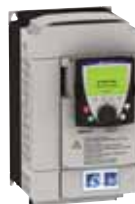
Variador de velocidad Altivar 61