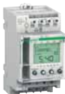
Interruptor horario IHP