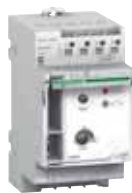
Interruptor crepuscular IC2000